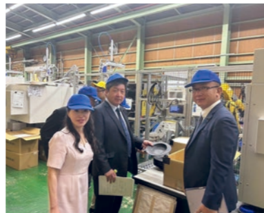
石川樹脂工業(株)にて