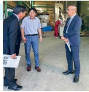
(有)安井ファームにて