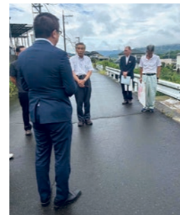
農業体質強化基盤整備促進事業 (香南町)