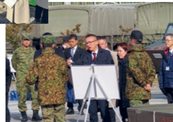
陸上自衛隊第14旅団にて現地説明