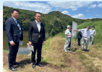
奥池 (綾川町) におけるため池改修