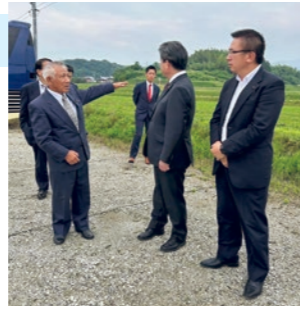
ひまわりの里まんのうにて