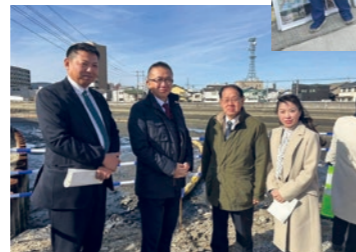
御坊川津波対策河川事業にて